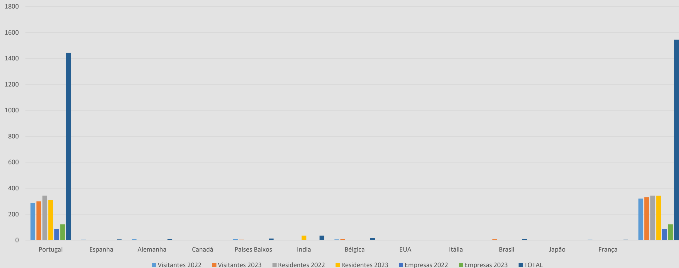
Dados Acumulados por Nacionalidade & Segmento